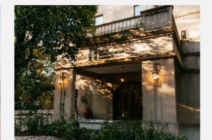
Hotel Plaza Central Canning