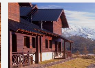
AMANCIO Hotel & Cabañas