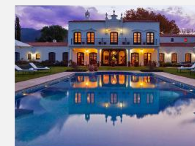
Patios de Cafayate