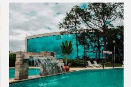
Hotel Casino Acaray