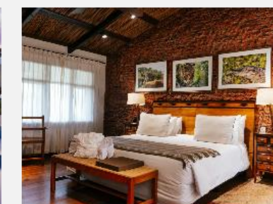
El Tránsito Hotel Boutique