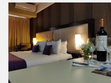
BENS Recoleta Park