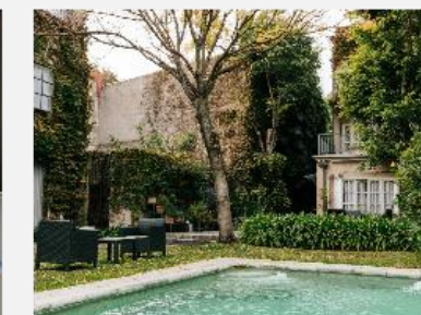
BENS L'Hotel Palermo