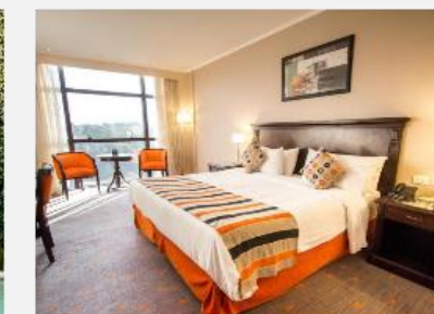
Hotel Casino Carnaval